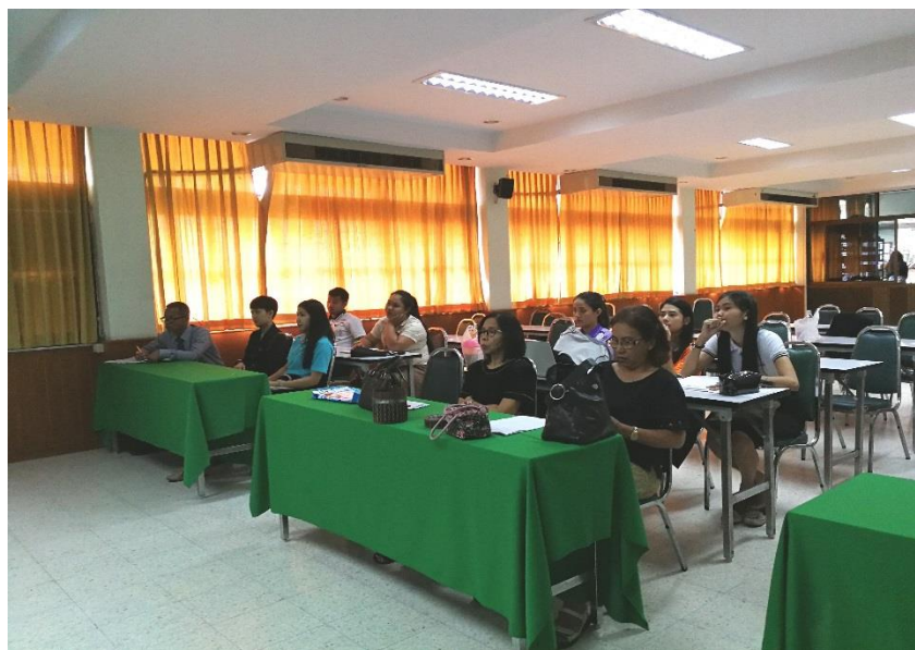
มีครูเข้าร่วมอบรมทั้งสิ้น จำนวน 44 คน