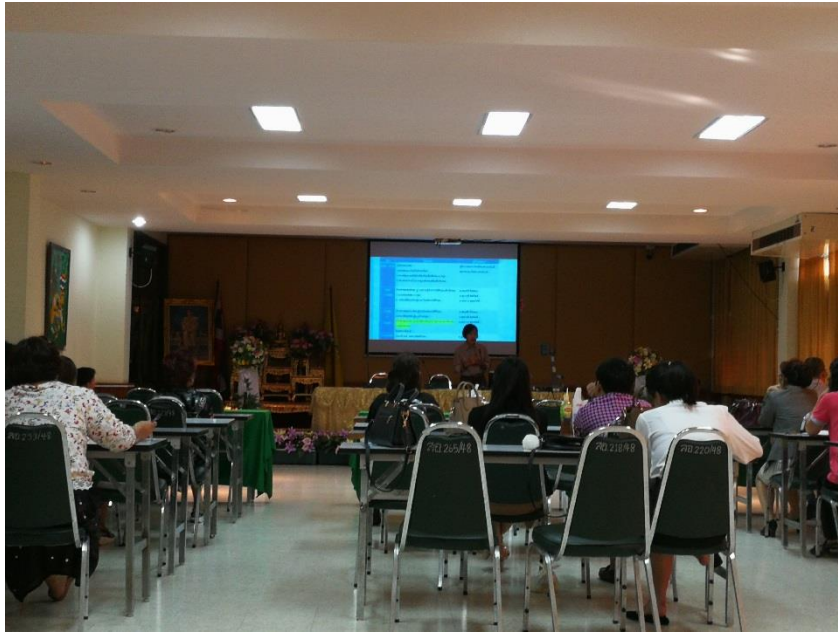
ผศ.ดร.ละอียด แอ้มอินทร์ บรรยายและอภิปราย ความรู้ความเข้าใจเกี่ยวกับเด็กพิเศษ