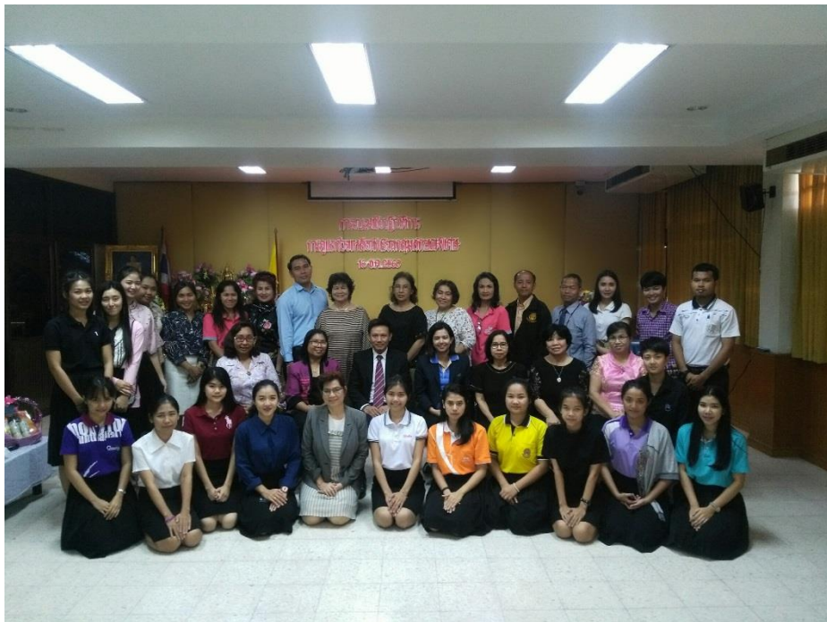
ถ่ายภาพหมู่เป็นเกียรติร่วมกับผู้เข้าอบรม